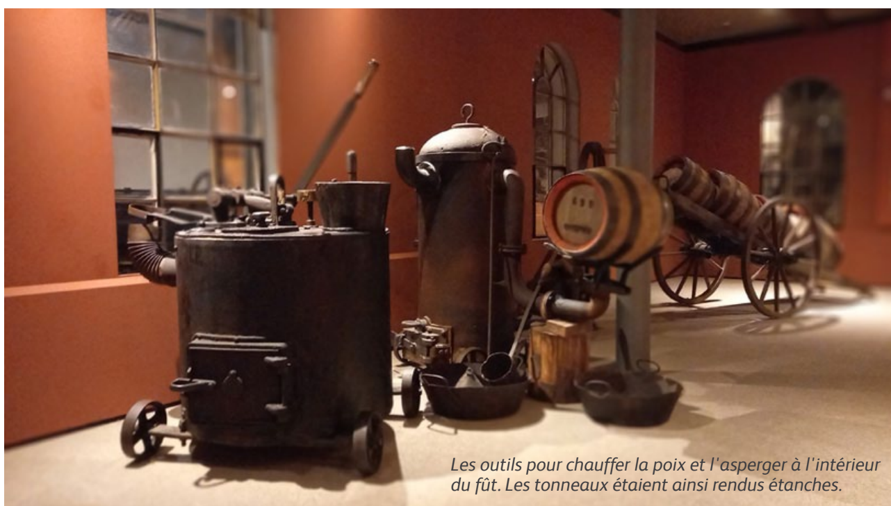
Les outils pour chauffer la poix et l'asperger à l'intérieur du fût. Les tonneaux étaient ainsi rendus étanches.