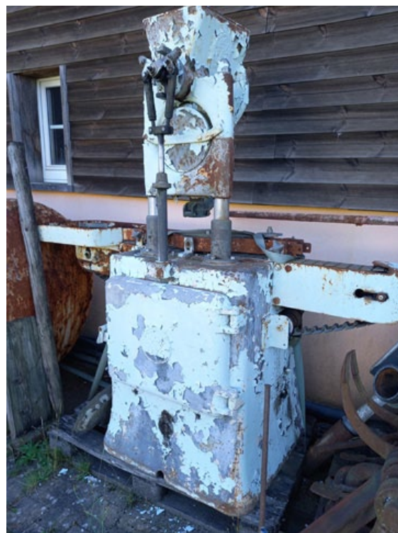
L'état de la capsuleuse avant la rénovation.

Ayant été exposée aux intempéries pendant 5 ans, les couleurs de la machine s'étaient écaillées au fur et à mesure. Nous devons donc procéder à la rénovation totale avec l'enlèvement de toutes les couches. Toutes les pièces amovibles ont été démontées pour subir un nettoyage en profondeur. Seul le système d'engrenages à l'intérieur n'a pas été démonté. Protégé par une épaisse couche graisseuse de 5 mm, l'engrenage reste toujours en parfait état de marche. Malheureusement, le moteur d'activation avec sa roue d'engrenage à dents obliques