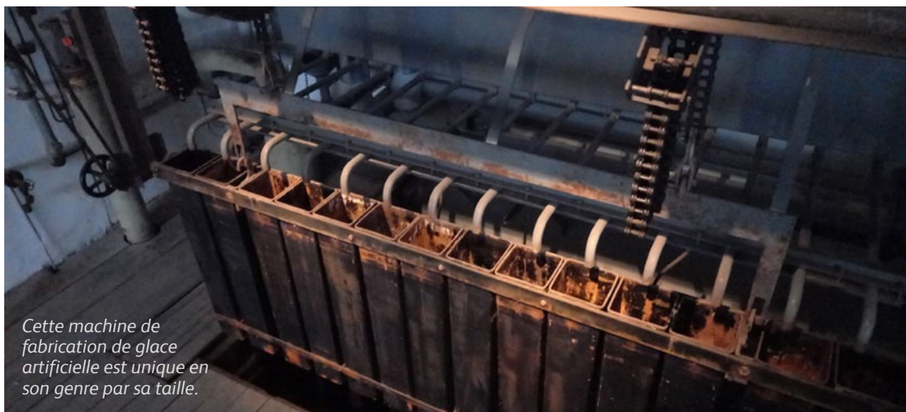
Cette machine de fabrication de glace artificielle est unique en son genre par sa taille.

petite surprise. Le musée des figurines d'étain du Plassenburg abrite également une collection de couvercles en étain de chopes . Accrochés au mur, ils comptent une multitude de formes et de couleurs de ces couvercles, censés protéger initialement la bière d'insectes et de feuilles mortes dans les Biergärten.