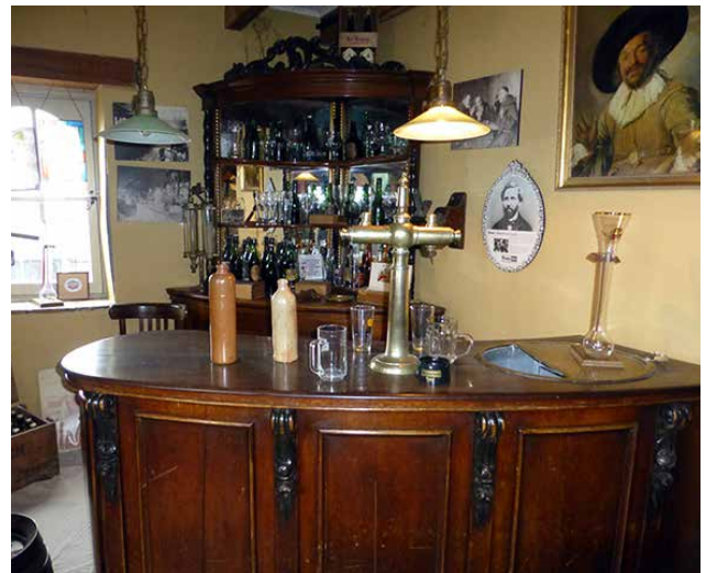
Ci-dessous : éléments d'un ancien bistrot néerlandais.

ancestrale hollandaise qui a contribué à la renommée nationale. Plus d'infos sous : www.kaasmuseum.nl