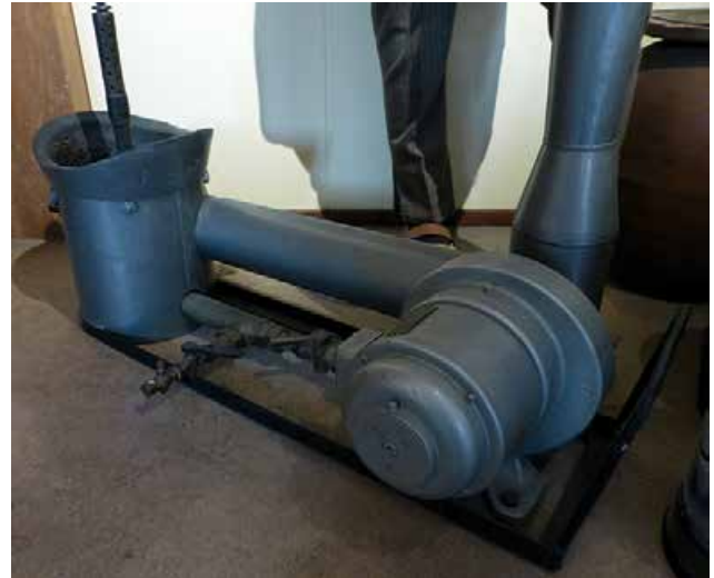
Ci-dessus : une installation de goudronnage de fûts, qui est une pièce très rare...

A quelques mètres se trouve un autre musée qui vaut le détour : « Het Kaasmuseum » (inutile de traduire). A l'aide d'une scénographie hors du commun, le visiteur découvre cette tradition