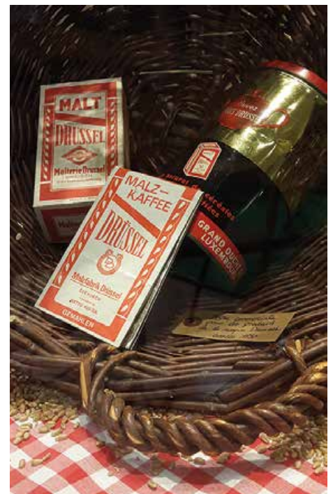
Des emballages pour le café à base de malt de la malterie Drussel de Diekirch.