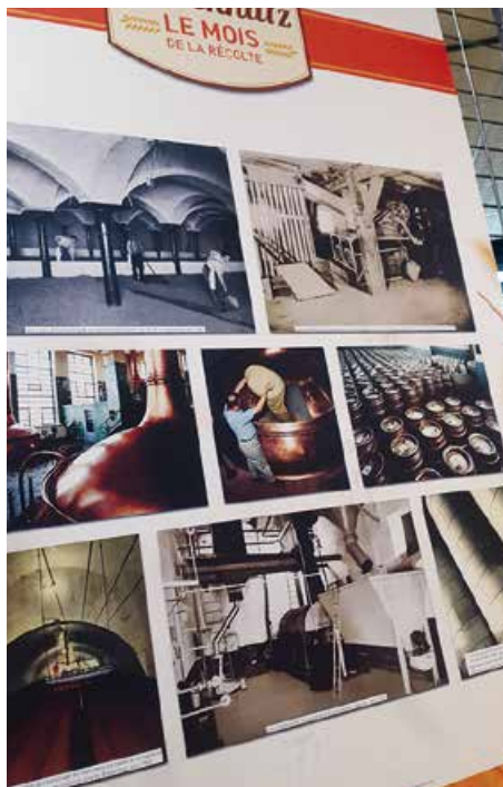
Plusieurs vues d'installations de malteries au Luxembourg.