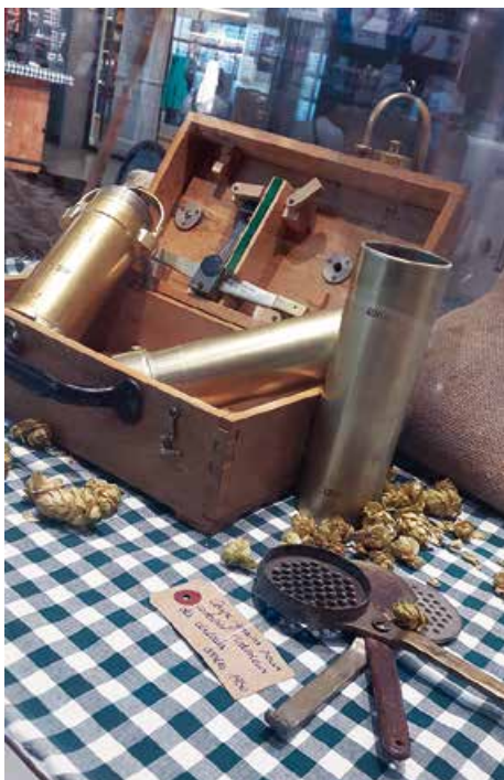
Les outils du brasseurs nécessaires au contrôle de la qualité des grains.